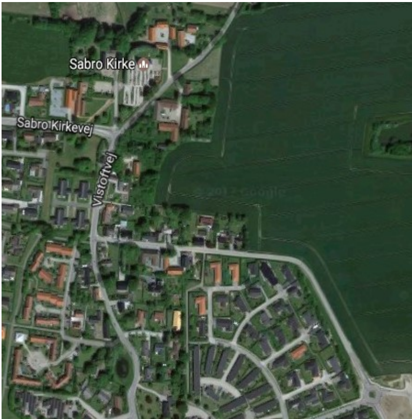
Google maps 2017