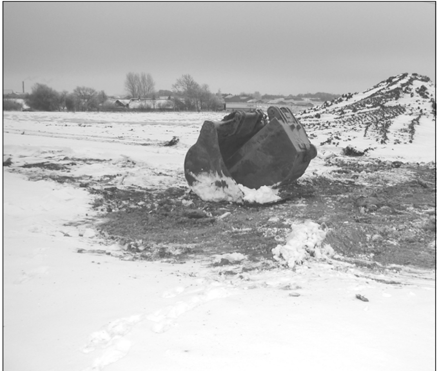
På dette areal mellem Edw. Rahrs Vej og Sintrupvej i Brabrand kommer den nye genbrugsstation. På billedet og umiddelbart over de to endnu slumrende graveskovle, ses de nye bebyggelser ved Helenehøst. Eventuelle gener af genbrugsstationen er søgt imødegået ved bestemmelser om etablering af tæt hegning og en bred beplantning, samt at selve anlægget nedgraves i terrænet.

Onsdag den 14. december skriver Århus Stiftstidende følgende: