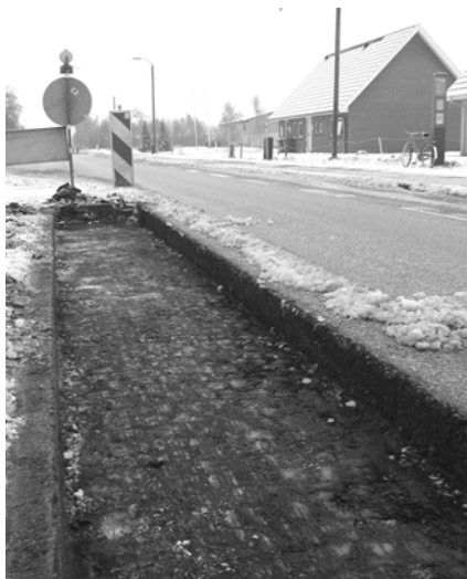
Man kan med lidt god vilje ane mønstret i den blotlagte, tjæresværtede brolægning på Gammel Viborgvej.

I forbindelse med etablering af midterheller i Mundelstrup var der få dage i slutningen af november blotlagt en kulturskat under Gammel Viborgvej.