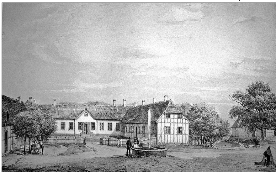
Ristrup i 1700-tallet