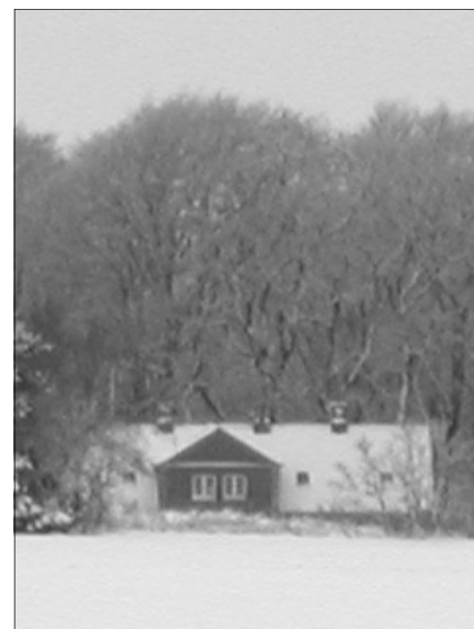
Det tidligere alderdomshjem på Ristrupvej